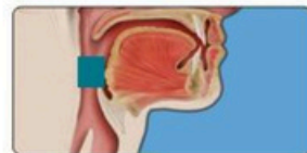
La orofaringe es el área en azul en la parte posterior de la lengua y garganta